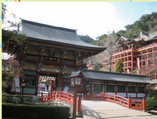
祐徳稲荷神社(日本三大稲荷)