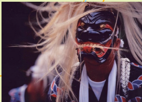
面浮立(佐賀県を代表する伝承芸能)