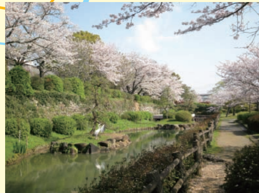
旭ヶ岡公園(日本の歴史公園100選)