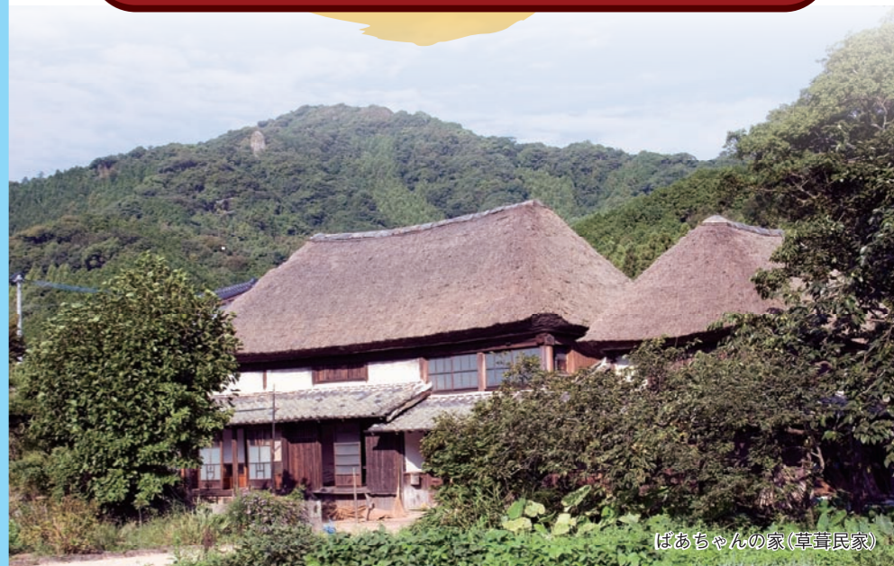
ばあちゃんの家(草葺民家)