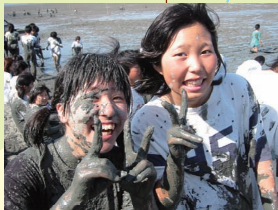
道の駅鹿島(干潟体験)